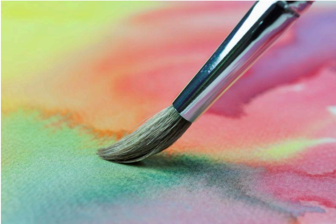
Kuva: Siveltimen jälkeä