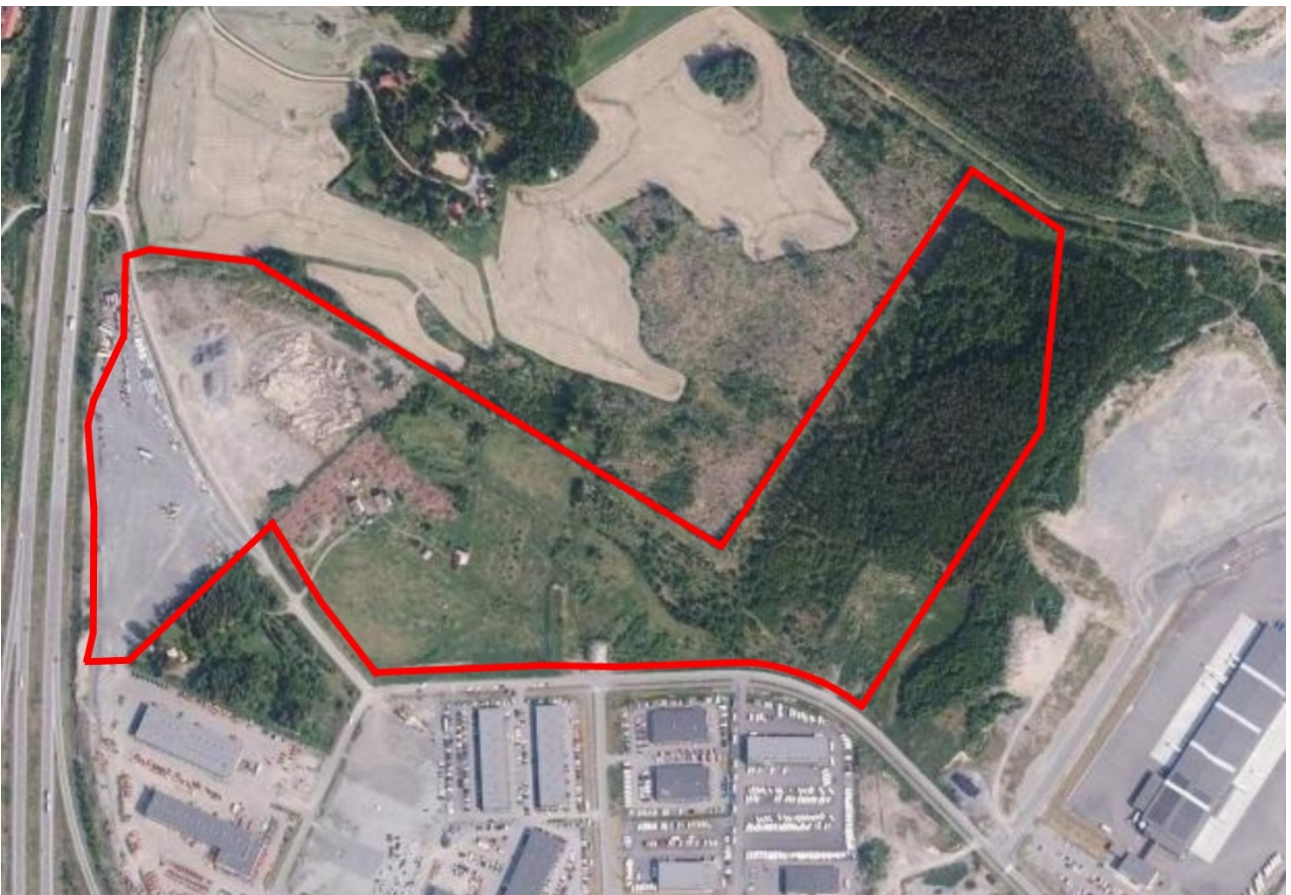
Kuva: Asemakaavan muutosalue rajattuna punaisella.

Kaava-alue sijaitsee Lempäälän Marjamäessä, Realparkin alueen pohjoispuolella olevien neljän kiinteistön osasta. Kaava-alueen koko on 248 398m 2 eli noin 24,8 ha. Alue on ennestään asemakaavoittamaton. Kaava-alue sijoittuu Realparkinkadun ja Kalliokummuntien pohjoispuolelle. Kaava-alue on osittain kunnan, osittain yksityisen maanomistajan omistuksessa.