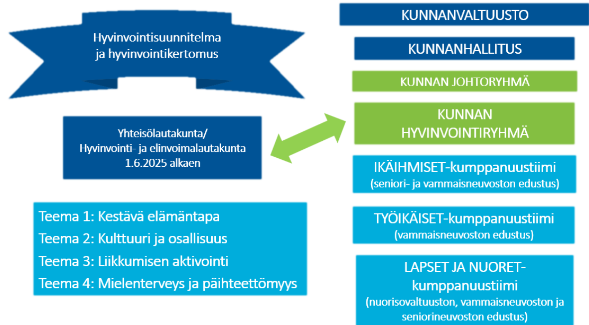
Kuvio1 . Hyvinvoinnin edistämisen yhteistyörakenne 2022-2024

Vuonna 2025 valmisteltiin laajassa yhteistyössä Lempäälän kunnan hyvinvointiohjelmaa vuosille 2026-2029. Hyvinvointiohjelma hyväksyttiin kunnanvaltuustossa 22.4.2026. Hyvinvoinnin ja osallisuuden edistämisen yhteistyörakenteita päivitettiin hyvinvointiohjelman valmistelun yhteydessä. Uudet yhteistyöryhmät aloittavat toimintansa keväällä 2026.