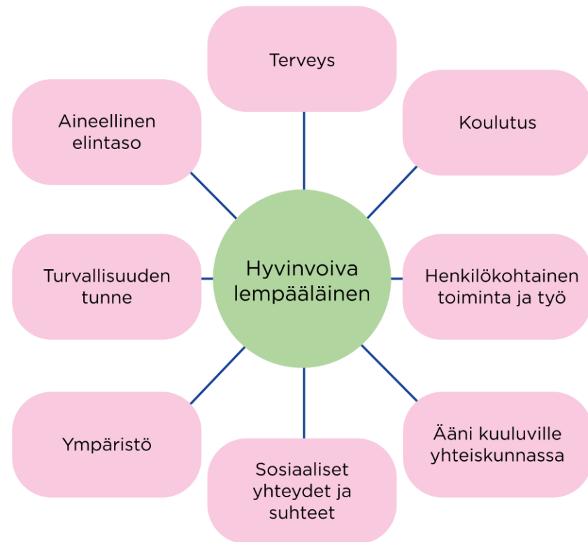
Kuvio 2. Stiglitzin komission hyvinvoinnin osa-alueet (Stiglitz J., Sen, A., Fitoussi, J-P. 2009: Report by the Commission on Measurement of Economic Performance and Social Progress)

Hyvinvoinnin, terveyden ja osallisuuden edistämistyön tavoitteena on vaikuttaa kuntalaisten elämän sujuvuuteen, mahdollisuuksiin huolehtia omasta hyvinvoinnista sekä kokemukseen toimivasta ja merkityksellisestä arjesta Lempäälässä.