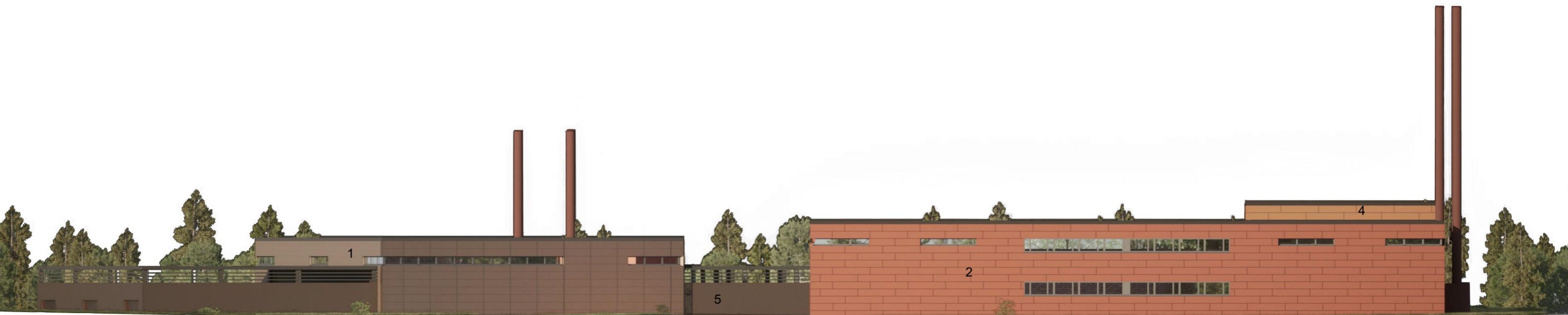
Katujulkisivu itään Nurmisaarentie