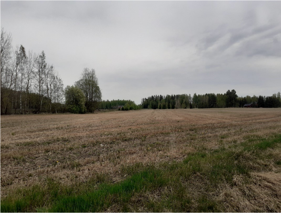
Kuva 5. Turuntien itäpuolista peltoaluetta. Vasemmassa laidassa näkyy puurivistö peltoalueen ja junaradan välisellä alueella.