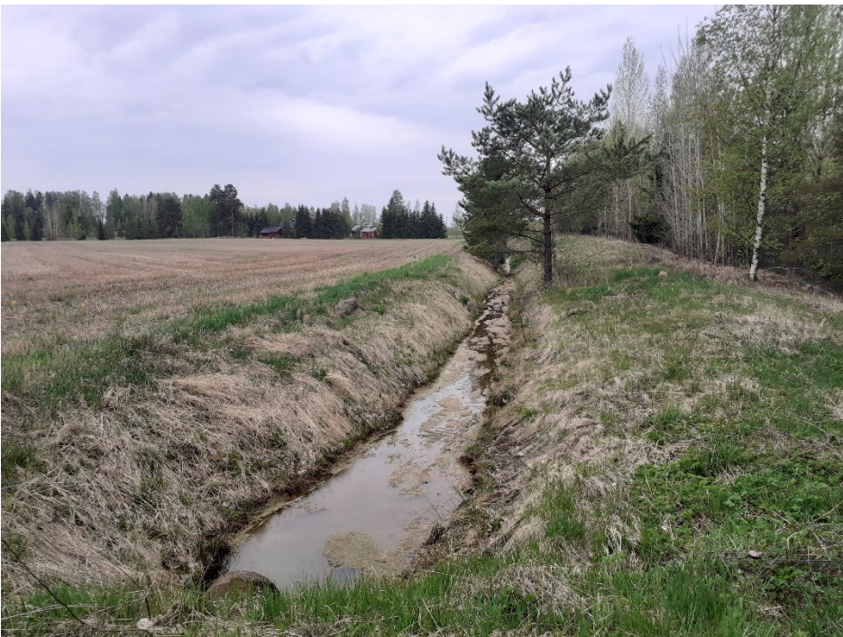
Kuva 9. Turuntien itäpuolella sijaitseva kaivettu oja penkereineen.

Turuntien itäpuolella tien ja pellon välissä on kaivettu oja. Tien ja ojan välissä kasvoi pääosin heinävaltaista kasvillisuutta sekä puita. Lisäksi havaittiin runsaasti tarkasteluhetkellä vielä pienikokoisia komealupiinikasvustoja.