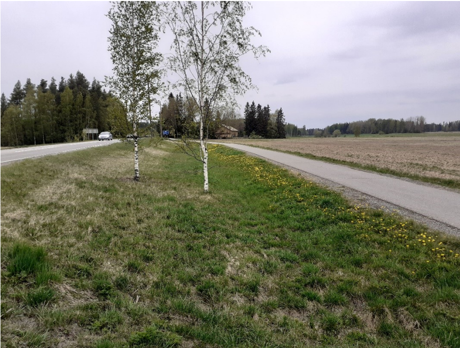
Kuva 2. Vesilahdentietä pientareineen ja kevyenliikenteenväyläineen. Vieressä selvitysalueen pohjoisosan peltoaluetta.

Selvitysalueella kulkee Turuntie, Viialantie ja Vesilahdentie sekä pienempi Myllyvainiontie. Isompien teiden teialueeseen kuuluu tienpientareet, joissa kasvaa pääosin heinävaltaista kasvillisuutta. Lisäksi joukossa on joitakin yleisempiä kukkivia kasveja, muun muassa voikukkaa, maitohorsmaa, leskenlehteä ja siiankärsämöä. Vesilahdentien ja sen vieressä kulkevan kevyenliikenteenväylän välissä kasvaa muutama koivu. Viialantien pientareella on lähempänä Turuntien risteystä koivurivistö. Turuntien pientareella kasvaa rautatien ja Viialantien risteuksen välisellä alueella runsaasti puustoa, pääasiassa koivuja, haapoja ja kuusia.