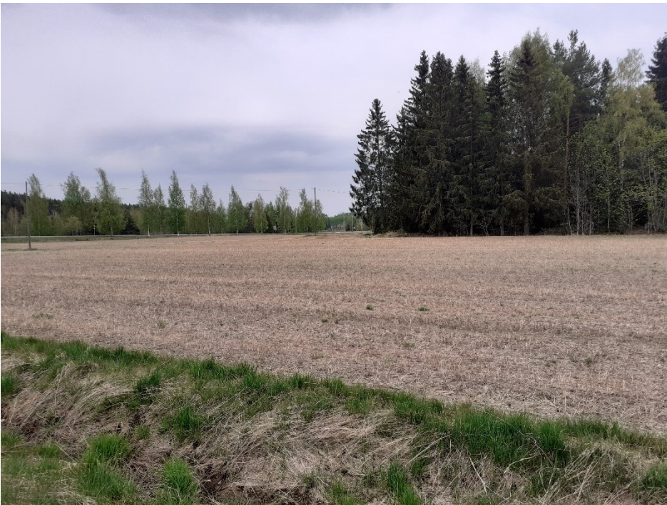
Kuva 4. Vesilahdentien eteläpuolinen peltoalue metsäsaarekkeineen. Taustalla näkyy Viialantietä ja sen varrella olevaa puurivistöä.