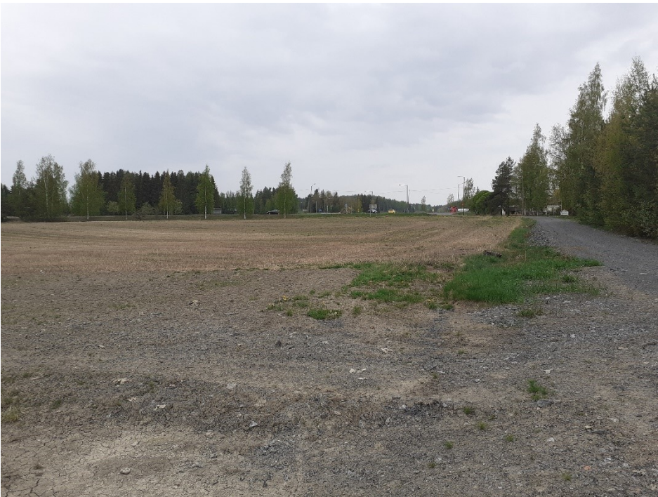
Kuva 6. Viialantien itäpuolen peltoalue ja junaradan huoltoaluetta.