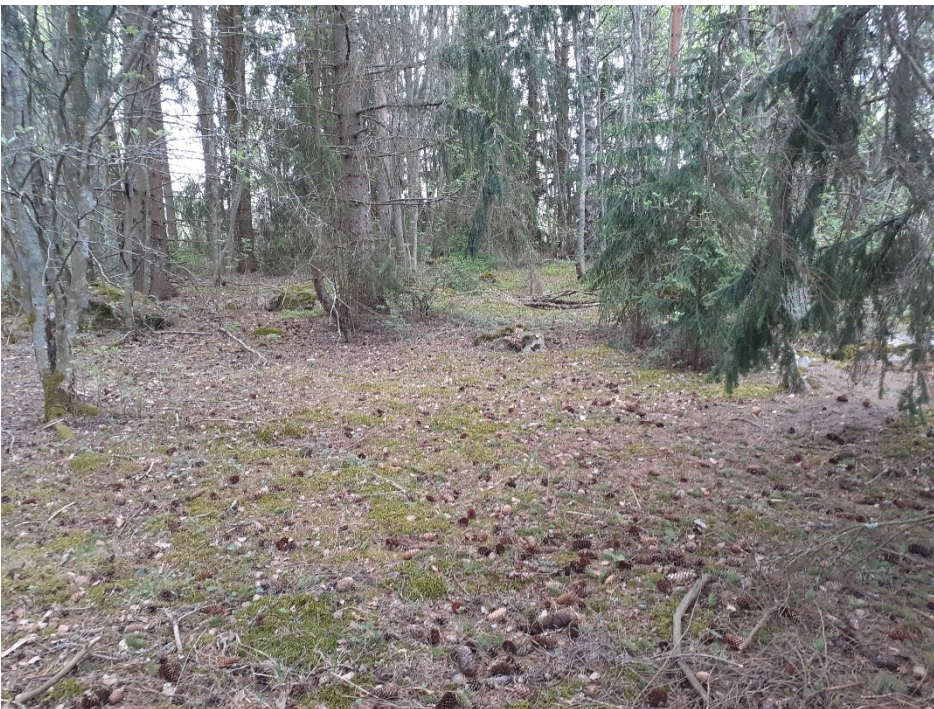
Kuva 7. Metsäsaarekkeen kasvillisuutta.

Alueen luoteisosassa on muutama pienialainen ketomainen laikku, joissa kasvaa jonkun verran perinnebiotoopeille usein tavattavaa lajistoa, kuten ahopukinjuurta ja huopakeltanoa. Uhanalaisia tai muuten huomionarvoisia ei tavattu. Ketomaiset laikut ovat voimakkaasti heinittyneitä hoidon puuteen vuoksi ja pääsoin umpeenkasvaneita. Ketomaisten laikkujen vieressä kasvoi muutama suurikokoinen kataja. Toinen näistä oli huomattavan komea, joskin varjostavan puuston vuoksi kasvanut toispuoliseksi.