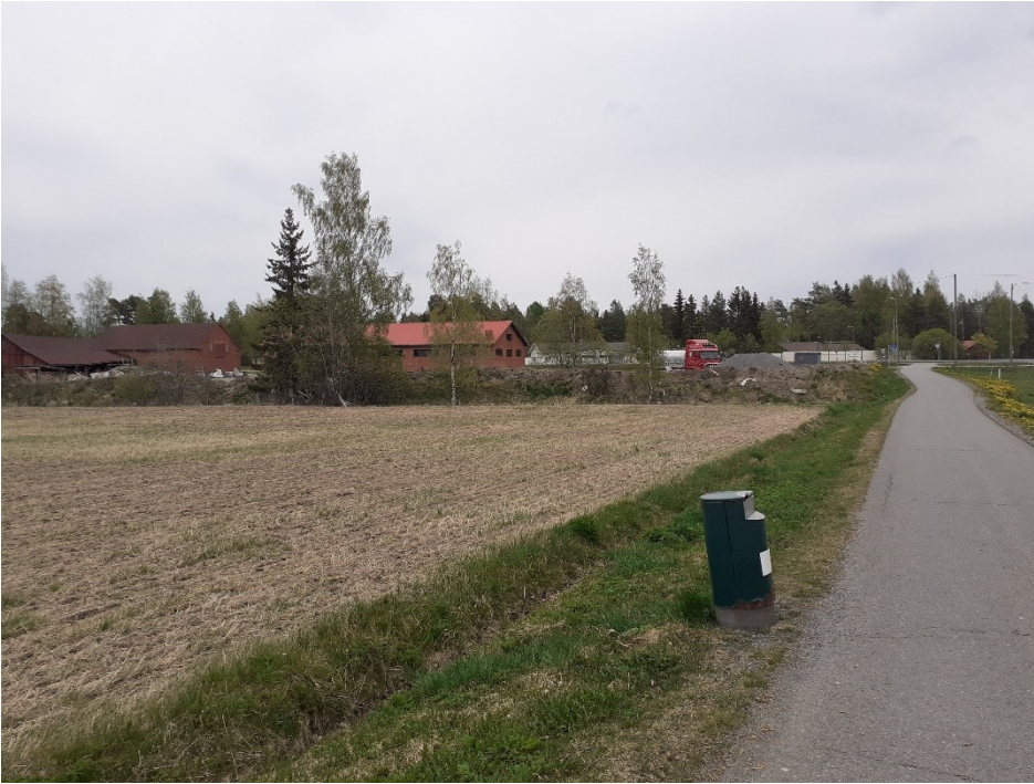
Kuva 3. Vesilahdentien kevyenliikenteenväylä, peltoaluetta ja rakennettua ympäristöä.