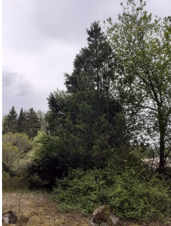
Kuva 8. Metsäsaarekkeen lounaisosan isokokoisia katajia, joiden läheisyydessä ketomaisia laikkuja.

Turuntien itäpuolella tien ja pellon välissä on kaivettu oja. Tien ja ojan välissä kasvoi pääosin heinävaltaista kasvillisuutta sekä puita. Lisäksi havaittiin runsaasti tarkasteluhetkellä vielä pienikokoisia komealupiinikasvustoja.