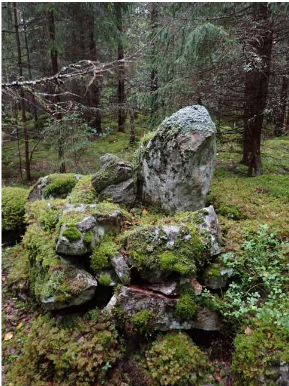
Rajamerkki sijoittuu nykyiselle kiinteistörajalle. Rajamerkki kuvattuna kohti länttä.