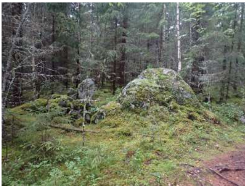
Ison maakiven vieressä oleva rajamerkki. Luoteeseen.

Valmistelutöiden aikana tarkastettiin mainittujen vanhojen karttojen lisäksi Museoviraston ylläpitämä Kulttuuriympäristön palveluikkuna (kyppi.fi) ja MML:n maastokartat, rinnevarjoste- ja ortokuvat sekä GTK:n varjostettu korkeusmalli. Lisäksi kohteen yleisöilmoituksesta kysyttiin kohteen tarkempia tietoja Pirkanmaan maakuntamuseolta.