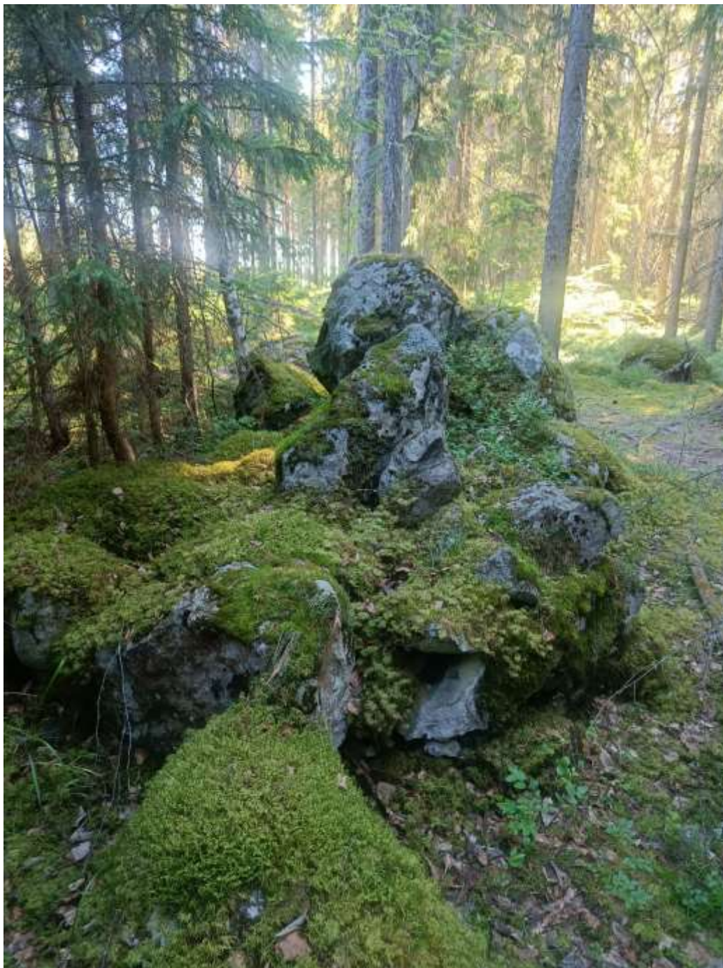
Rajamerkki kuvattuna koilliseen. Viisarikivi näkyvissä korkeampana, taustalla hahmottuu rajamerkissä kiinni oleva korkeampi maakivi.