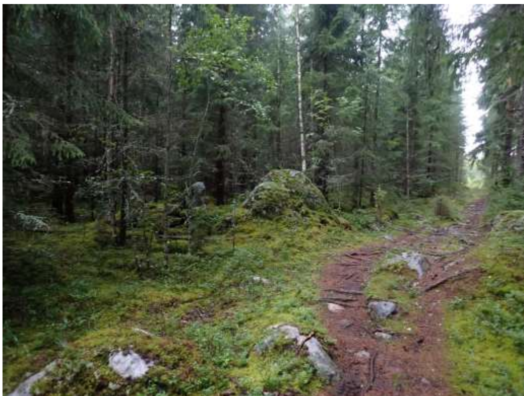
Yleiskuva rajamerkistä sankemman ja avarapohjaisemman metsän rajalla, polun vieressä. Pohjoiseen.

Heilu Oy / FM Tiia Tiainen teki Lempäälän Sääksjärvellä sijaitsevan mahdollisen muinaisjäännöksen (Isonkivenmaa, muinaisjäännöstunnus 1000031458) arkeologisen tarkastuksen elokuussa 2024. Tarkastus liittyi alueen yleiskaavoitukseen ja sen tarkoituksena oli selvittää kohteen muinaisjäännösstatus. Tarkastuksen kohteena oleva mahdollinen muinaisjäännös on yleisöilmoitukseen perustuva rajamerkki, jota ei aiemmin ole tarkastettu arkeologisten maastotöiden yhteydessä.