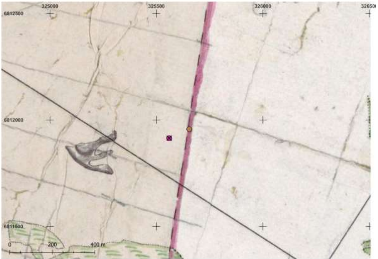
Yllä ote vuoden 1842 pitäjänkartasta, alla ote vuoden 1830 Nurmikunnan rinta- ja ulkomaiden kartasta.