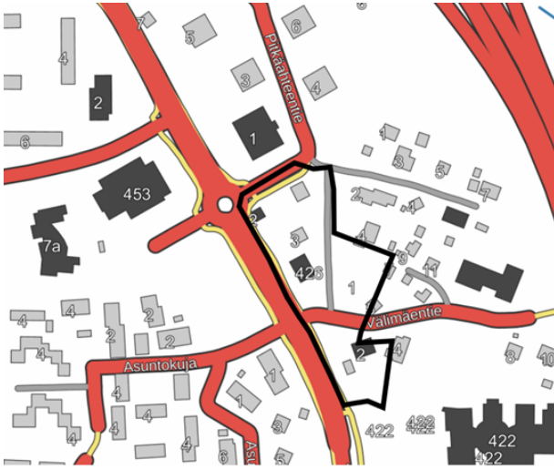
Kuva 1 Alustava suunnittelualan rajaus kartalla. Alue on laajuudeltaan noin 0,9 ha.