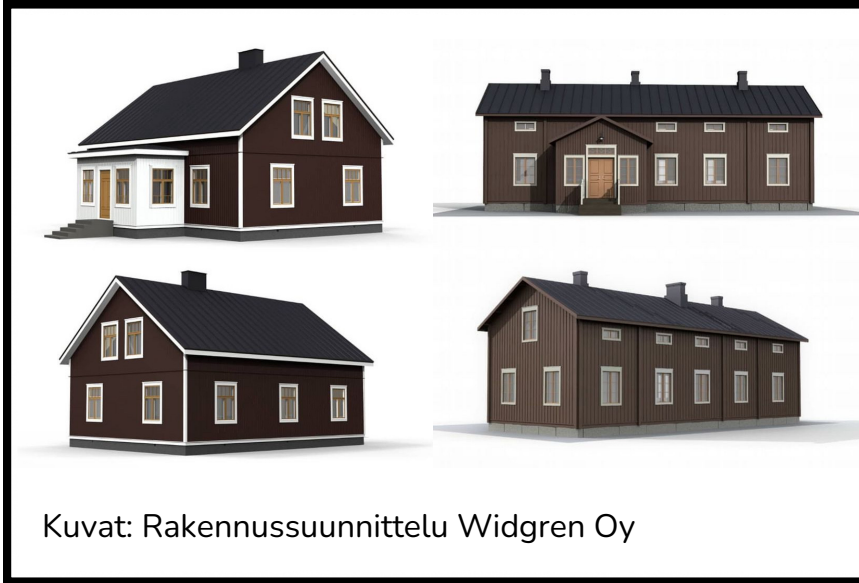
Kuvat: Rakennussuunnittelu Widgren Oy