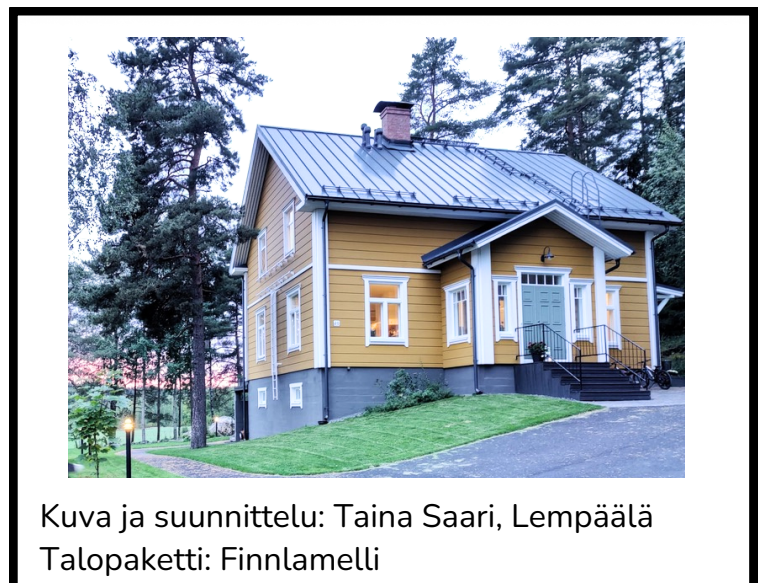
Kuva ja suunnittelu: Taina Saari, Lempäälä Talopaketti: Finnlamelli