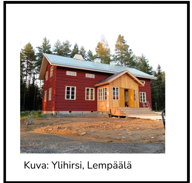
Kuva: Ylihirsi, Lempäälä