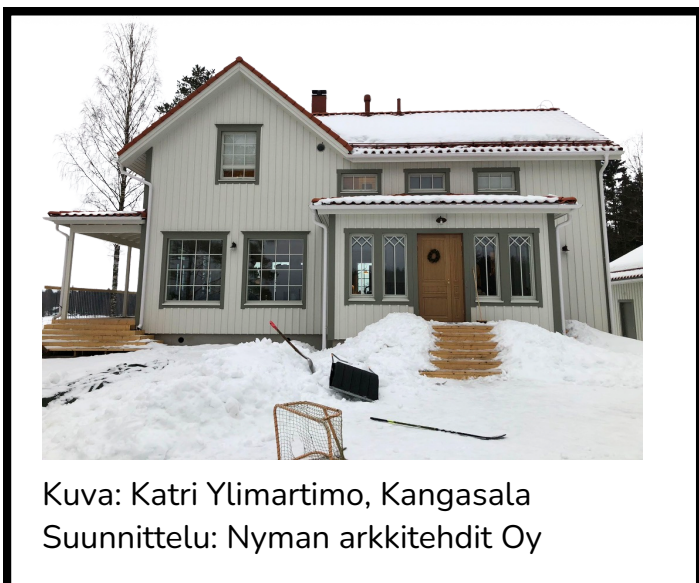
Kuva: Katri Ylimartimo, Kangasala Suunnittelu: Nyman arkkitehdit Oy