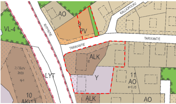
Ote asemakaavayhdistelmästä. Suunnittelualueen liikimääräinen sijainti punaisella katkoviivalla.

Lisätietoja yleis- ja asemakaavasta: www.lempaala.fi/kaavayhdistelma