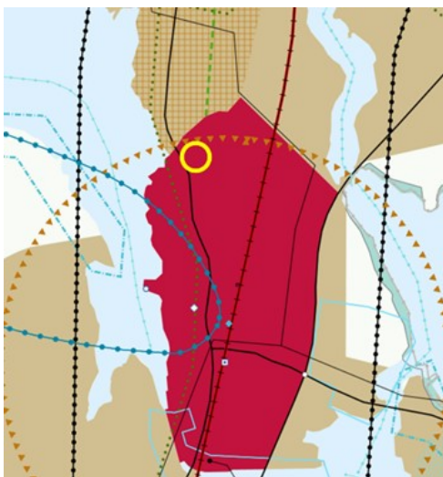
Ote maakuntakaavasta. Suunnittelualueen likimääräinen sijainti keltaisella ympyrällä.

Alue kuuluu myös kaupunkiseudun keskusakselin kehittämisvyöhykkeeseen, ulottuen Tampereen kaupunkikeskustasta Lempäälän keskusta. Suunnittelualue sijoittuu myös tiivistettävälle asemaseudulle, mikä tarkoittaa aluetta, jolla suunnitellaan yhdyskuntarakenteen tiivistämistä raideliikenteen tukemiseksi.