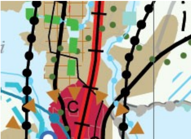
Kartta 2. Ote maakuntakaavasta

Maakuntakaavan mukaan Mäkisenpellon alue on taajamatoimintojen aluetta (ruskea väri) ja tiivistä joukkoliikennevyöhykettä (ruudutus). Suunnittelualue kuuluu kaupunkiseudun keskusakselin kehittämisvyöhykkeeseen (musta palloviiva). Maakunnallisesti merkittävä ulkoilureitti (Birgitan polku) on merkitty vihreällä palloviivalla ja viheryhteystarve vihreällä katkoviivalla. Siirtoviemäri ja yhdysvesijohto on merkitty ohuella mustalla viivalla.