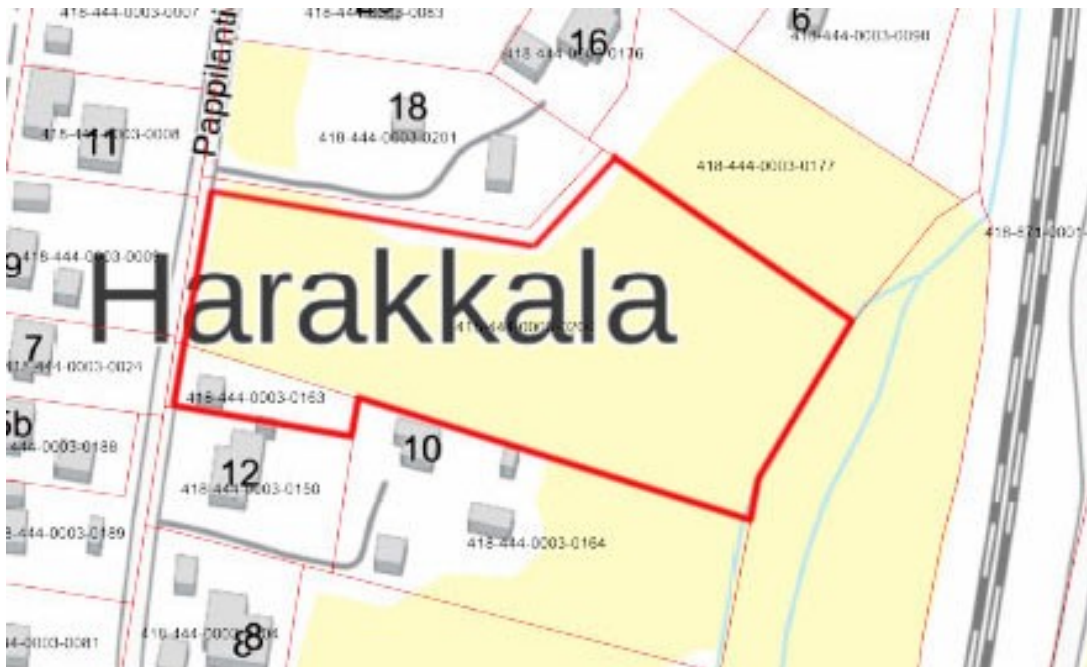
KARTTA 1. Suunnittelualueen sijainti ja likimääräinen raja

Suunnittelualue sijaitsee Harakkalassa Pappilantien ja rautatien välissä. Alueen koko on noin 1,1 ha.