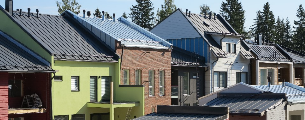
Kaupunkipientaloja Pirkkalan Tuohikorvessa