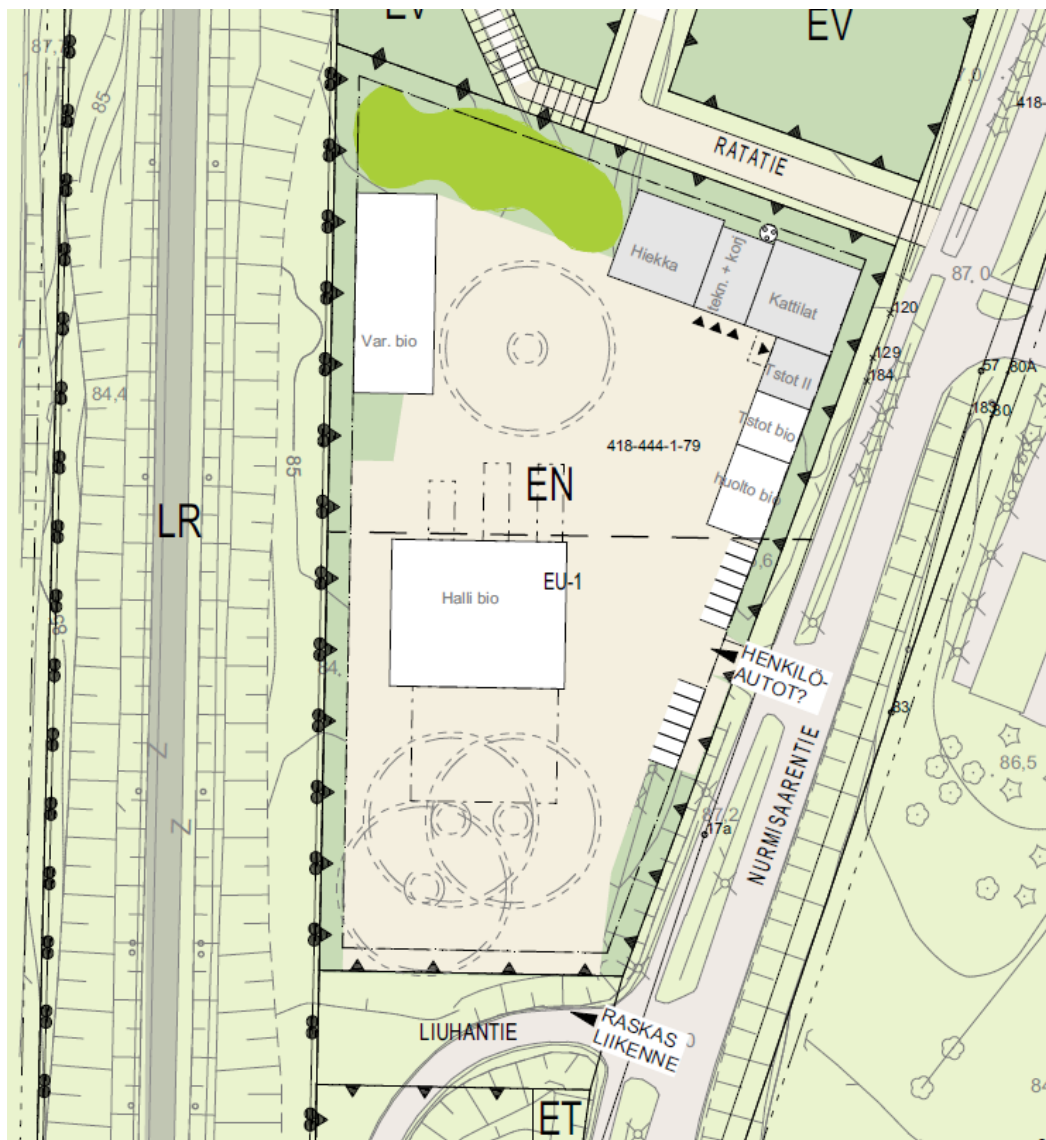
Kuva 1. Aluepiirros (alustava)