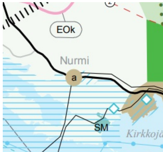
Kuva: Ote maakuntakaavasta