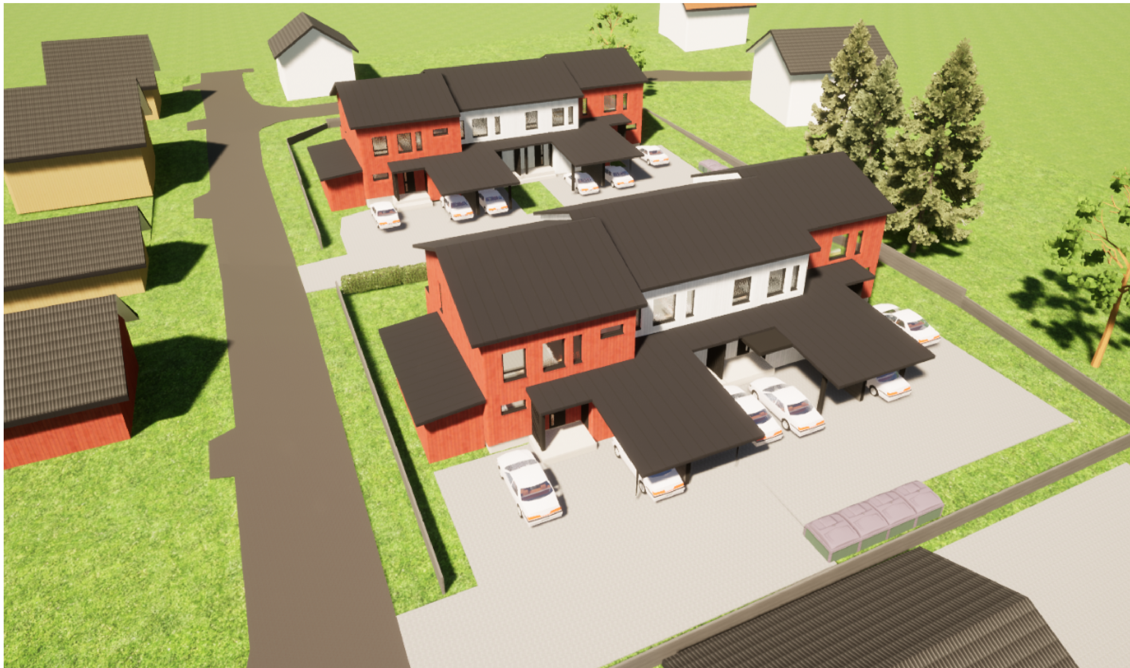
Yhtiömuotoisesti kaksi paritaloa, asuntoja 4 kpl