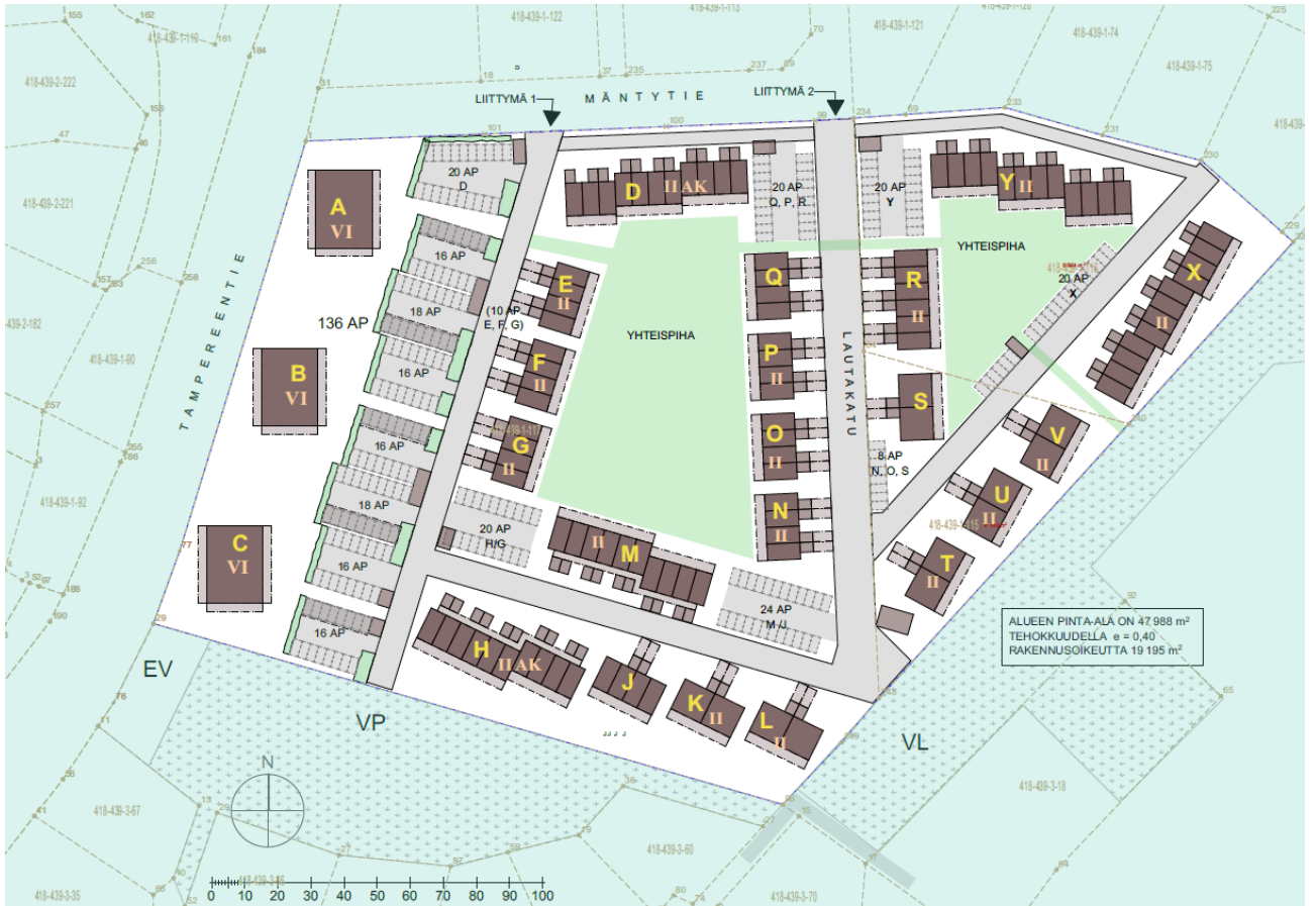
Kuva 1, Lohikallion alustava asemapiirros (19.1.2022)