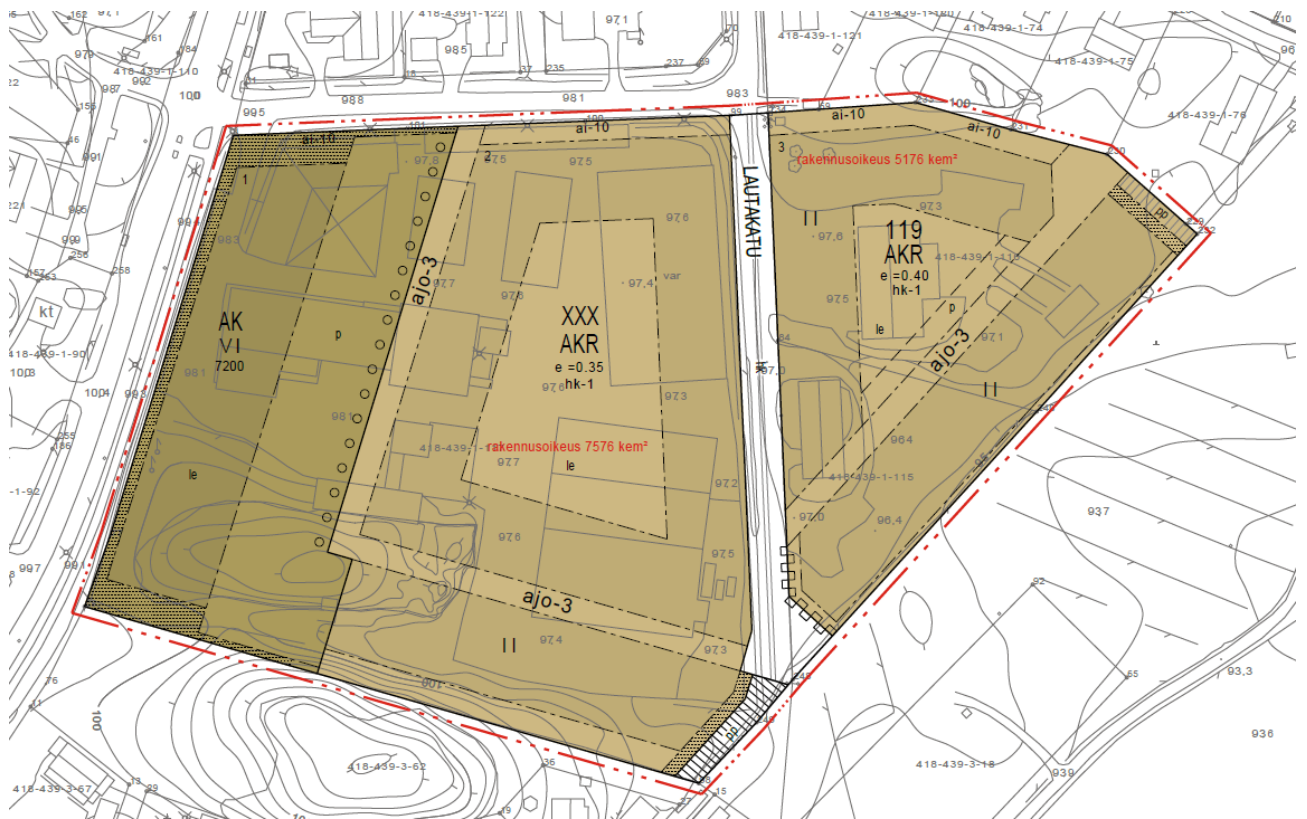
Kuva 2, Lohikallion asemakaavan muutos (Lempäälän kunta, 12.10.2021)