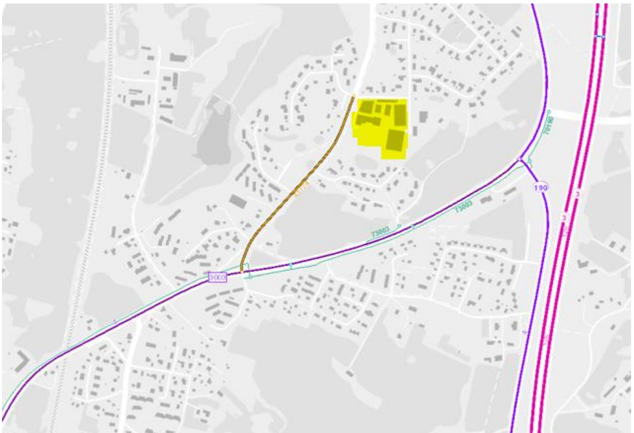
Kuva 3, Lohikallion asemakaava-alue ja sitä ympäröivät tiet sekä teiden luokitukset, kaava-alue merkitty keltaisella

Kaava-alueen pääväylinä toimii tällä hetkellä Kuljuntie ja Tampereentie. Pääväylien tehtävänä on välittää taajama-alueen läpi- ja ohikulkevaa autoliikennettä. Kaava-alueen pohjoisreunalla kulkeva Mäntytie toimii tonttikatuna. Kiinteistölle kulkee tällä hetkellä kohtalaisen paljon teollisuus toimintaan liittyvää raskasta liikennettä sekä työntekijöiden henkilöautoliikenne. Lisäksi Mäntytien kautta kohdealueen ohi kulkee noin 25 asuinkiinteistön pääasiallinen kulkuyhteys. Palvelu- ja yritystiloja ei kohteeseen olla toteuttamassa. Asemakaavan muutoksen ja teollisuus toiminnan päättymisen myötä säännöllinen raskas liikenne Mäntytiellä loppuu.