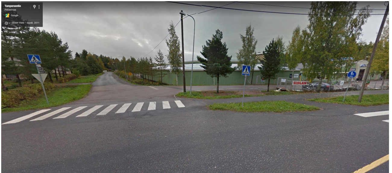
Kuva 5, Google Maps Street View kuvankaappaus Tampereentieltä kohti Mäntytieta (syyskuu 2011)

Alueella suoritettiin maastokäynti 8.3.2022, jonka perusteella liittymäjärjestelyt eivät ole muuttuneet verrattuna kuvan 6 tilanteeseen.