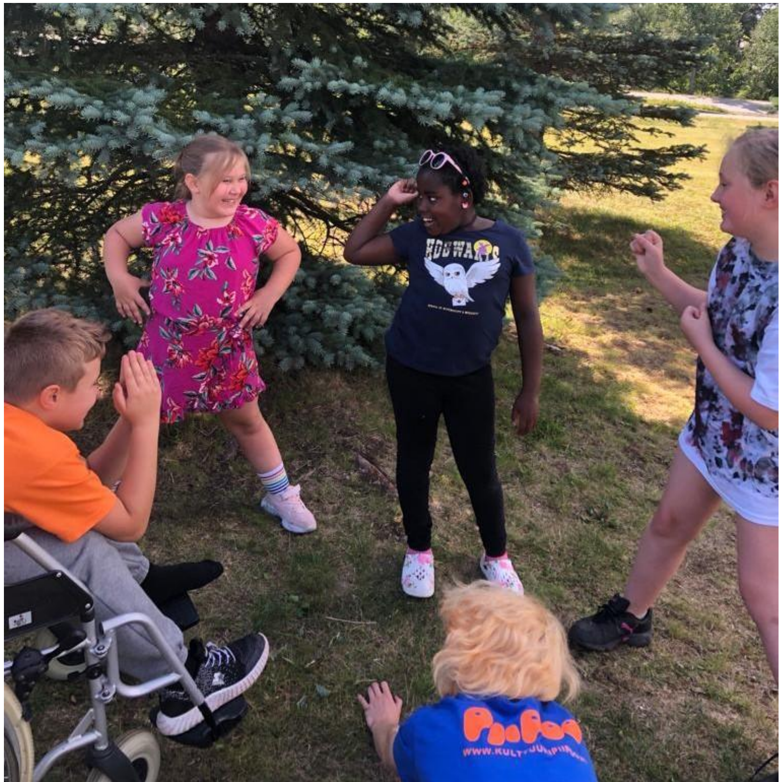
Kuva: Lasten taideleiriltä kesä 2022