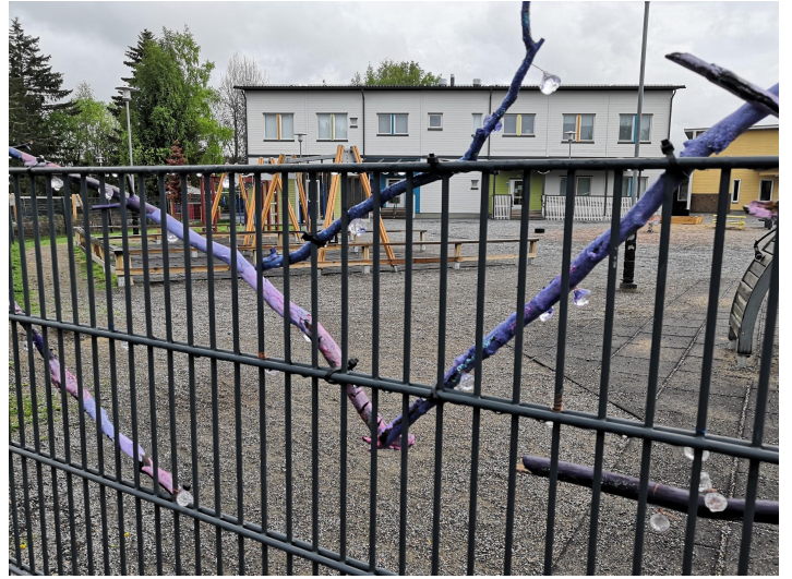
Siskonlinnan päiväkodin Taiteilija päiväkodissa -jaksolta syntyneitä töitä.