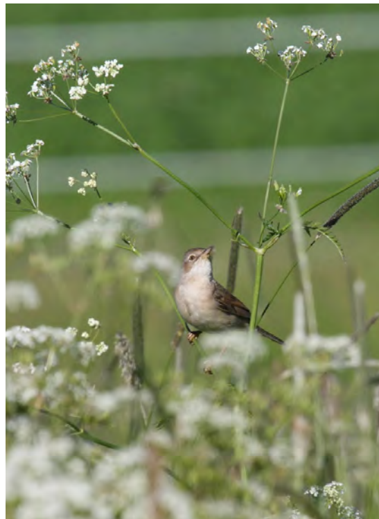
Pensaskerttu pesii alueella