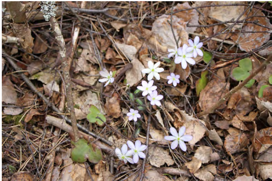
Valkokukkaista sinivuokkoa kasvaa lohkon 4 alueella