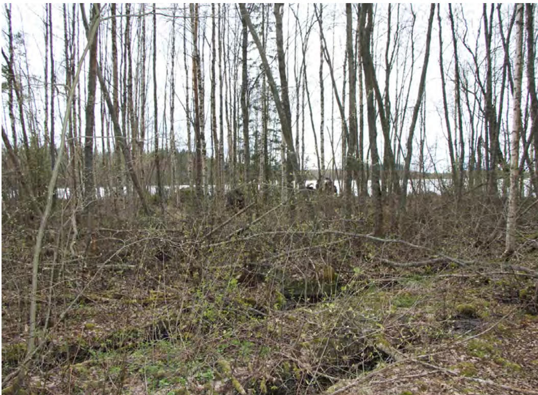
Rannan harmaaleppäreunusta lohkon 4 alueella