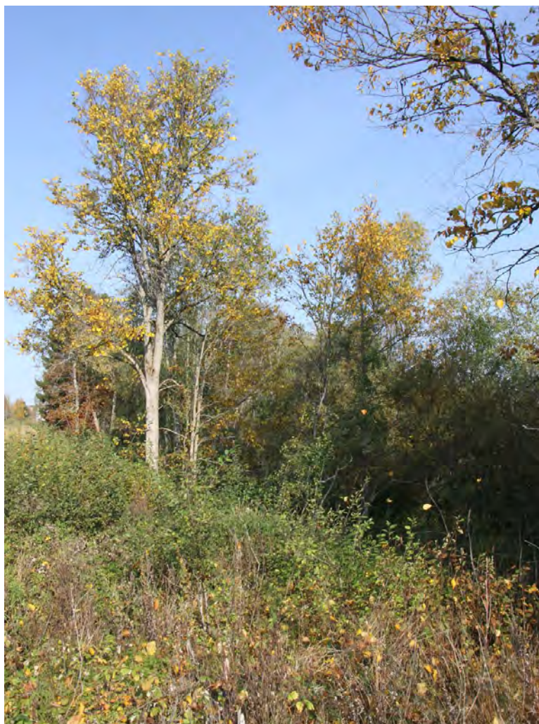
Kynäjalavia syysasussaan lohkon 10 alueella