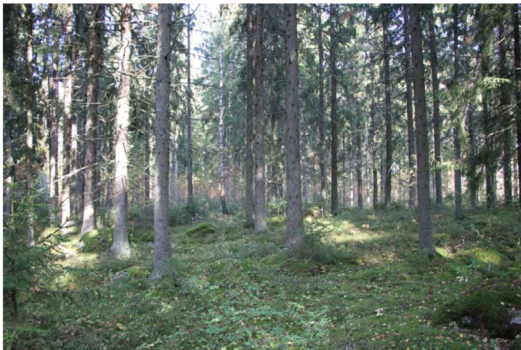
Lohkon 2 varttunutta kuusikkoa

Lohkon 2 pohjoispuolinen alue vanhan torppa saunarakennukselta rantaan asti on entistä peltoa/niittyä, jossa vanhat ojat ovat vielä näkyvissä. Ojitettu alue on istutettua rauduskoivikkoa. Pensaskerros koostuu kuusentaimista, vadelmista ( Rubus idaeus ) ja muutamista taikinanmarjoista. Aluskasvillisuus on kulttuurivaikutteista ja lajistoon kuuluu mm. vuohenputki ( Aegopodium podagraria ), ojakellukka ( Geum rivale ), peltokorte ( Equisetum arvense ) ja nurmilauha ( Deschampsia cespitosa ). Muutamain kohdin ojien reunoilla kasvaa hiirenporrasta. Istutuskoivikon ja rannan väliin jää kapea lehtomainen reunus, josta puusto on varttunutta ja koostuu