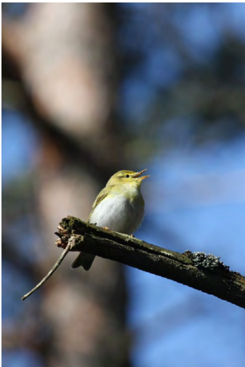
Lohkon 1 alueella oli 2 sirittäjäreviiriä

Aikainen pesijä, jonka laulukausi on usein jo ohi toukokuussa. Lajista tehtiin poikuehavainto lohkon 10 alueella lähellä kartanon pihapiiriä. Laji rakentaa tavallisesti katajaan, mutta nykyisin suuri osa lajin pesistä rakennetaan pihojen tuija istutuksiin. Loisen aiheuttama trikomonoosi sairaus on aiheuttanut lajin joukkokuolemia ja sen pesimäkanta Suomessa on enää murto-osa aiemmasta.