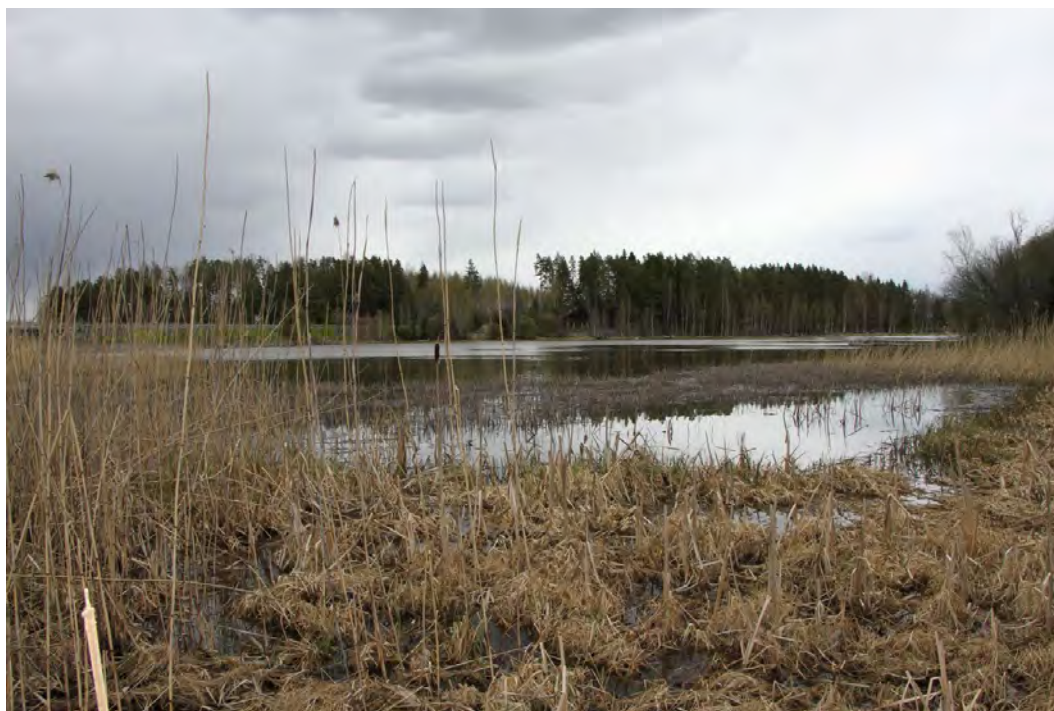
Viitasammakoiden kutualuetta lohkon 1 alueella

Laji ei Suomessa kuitenkaan ole uhanalainen, vaikkakin erityisesti monet pienten kosteikoiden esiintymät ovat hävinneet mm. rakentamisen ja metsäojitusten vuoksi. Paikoin myös turvetuotanto on hävittänyt suuria viitasammakpopulaatioita. Lounaiselta saaristoalueelta laji on monilta kohteilta nopeasti hävinnyt supikoiran leviämisen ja runsastumisen vuoksi. Erityisesti kutuaikana kosteikkosaalistukseen sopeutunut supikoira voi pienissä populaatioissa aiheuttaa merkittävää haittaa viitasammakoille.