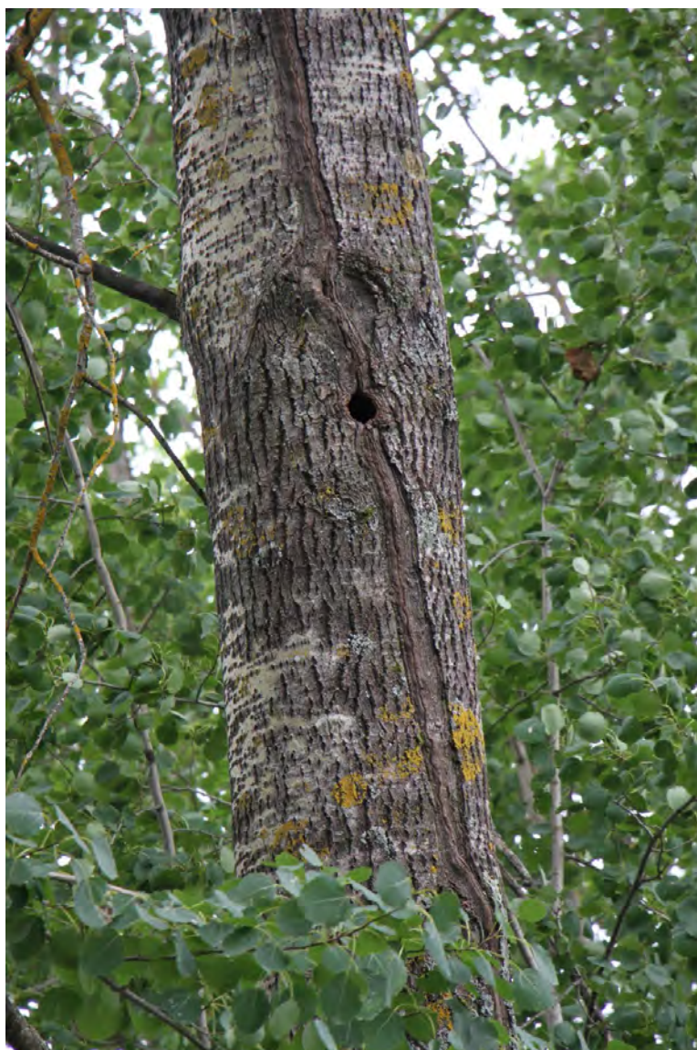
Liito-oravan käyttämä kolo lohkon 7 alueella

Lohkon alueeseen kuuluu tien ja järven väliin jäävä haapavaltainen metsäkuvio. Tällä kapealla alueella puusto on poikkeuksellisen kookasta ja alueella kasvaa noin 20 kookasta haapaa. Muuhun puustoon kuuluu yksittäisiä kuusia, pihlajia ja rauduskoivuja, sekä kynäjalavia. Yhteensä alueelta löytyi yhdeksän kynäjalavaa, joista kuitenkin puumaisia oli vain 4 ja loput olivat kantovesoja. Osa vesoista kasvoi puretun voimalinjauran alla. Kookkaiden ylispuuhaapojen lisäksi haapaa kasvoi myös aluspuustona sekä taimina. Puiden taimien lisäksi pensaskerroksen lajistoon kuuluu punaherukka, taikinanmarja ja koiranheisi. Lisäksi tienpuoleisella reunuksella ja rannassa kasvaa myös tuhkapajua. Metsätyyppi on alueella lähinnä kuivaa lehtoa, joskin rannanpuoleiset alueet ovat melko reheväkasvuisia. Aluskasvillisuuden lajistoon kuuluu mm. kivikkoalvejuuri ( Dryopteris filix-mas ), metsäimarre ( Gymnocarpium dryopteris ), lehtoarho, sinivuokko, lillukka, mustakonnanmarja ( Actaea spicata ) ja niukkana kasvava mäkilehtoluste. Alueella on useampia kolopuuhaapoja ja elokuun käynnillä yhdestä kolosta puikahti ulos liito-orava koputtelun seurauksena. Lohkon pesimälinnustoon kuuluu mustapääkerttu ja alueelta löytyi myös lehtokurppapokue. Alueen keskiosassa on pienvenelaituri, jonne johtaa polku tien suunnasta.