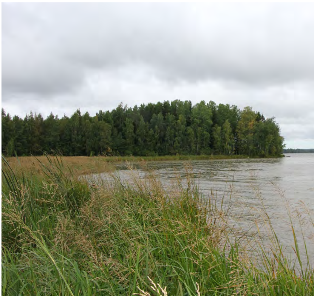
Luhdankantaa ympäröivät luhdat ovat isosorsimon valtaamia

Vanhan ja uuden tien väliin jää lehtipuuvaltainen harvennettu metsäkuvio. Puusto on istutettua rauduskoivikkoa ja melko nuorta. Rauduskoivun lisäksi alueen itäreunalla kasvaa jonkin verran kuusia ja alueella on myös kookkaampia raitoja. Aluskasvillisuus on paikoin rehevää ja alueella on laajoja sananjalkakasvustoja. Muutamin paikoin esiintyy kivikkoalvejuurta ja metsänalvejuurta. Aluskasvillisuudessa näkyy kulttuurivaikutusta mm. terttuseljan ( Sambucus racemosa ), jättipalsamin ja nurmilauhan esiintymisenä metsäalueella. Metsäalueen luontoarvot ovat vähäiset.