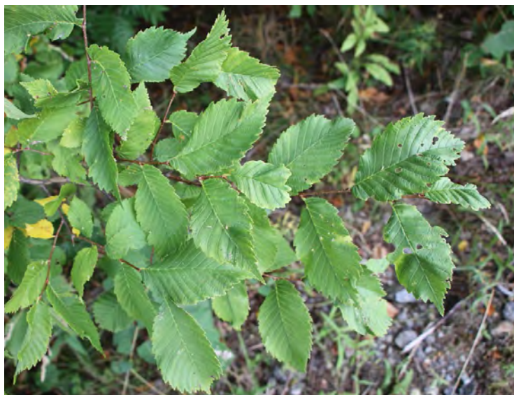
Osa alueen kynäjalavista on pensasmaisia