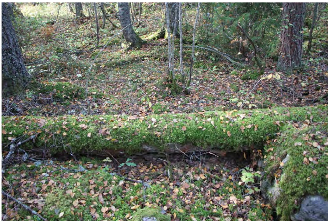
Lahoava maapuu lohkon 3 rantalehdossa