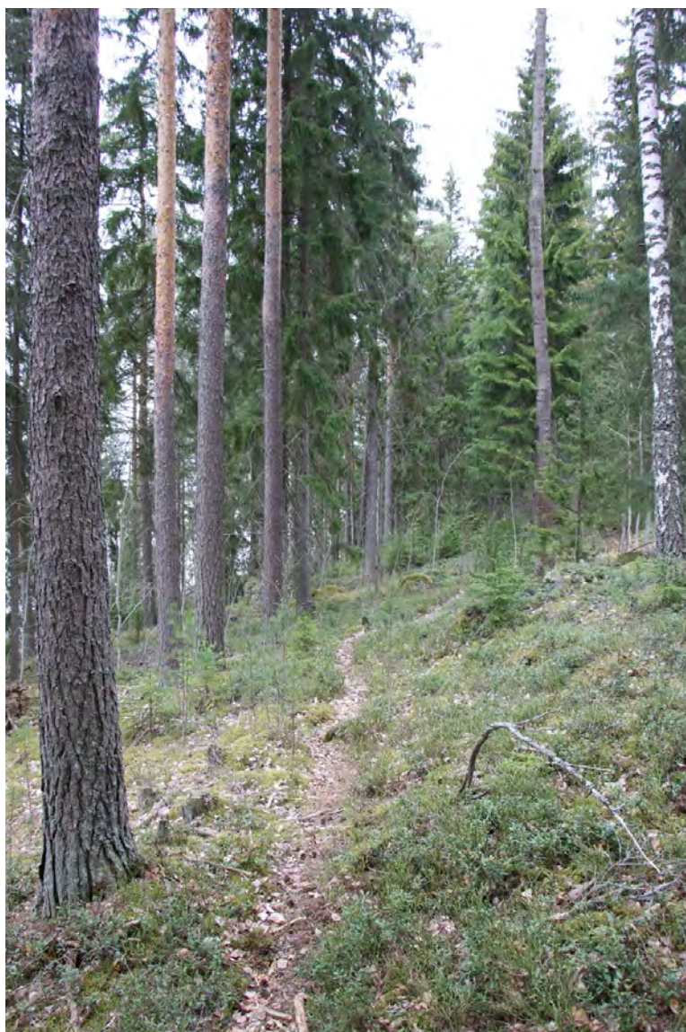
Yleiskuva Prikoolin- nolan länsireunalta (lohko 5)

Prikoolinniemen länsireuna on rinnemaastoon sijoittuvaa varttunutta kuusikkoa, jota on hoidettu talousmetsänä. Puusto on kuusivaltaista, mutta rinteän yläosassa mäntyä kasvaa hieman runsaammin. Metsätyyppi on tuoretta mustikkatyyppin kangasta ja aluskasvillisuuden valtalajiston muodostavat mustikka, puolukka ja metsälauha. Niukka pensaskerros muodostuu kuusen taimista ja muutamista katajista ( Juniperus communis ). Alueen keskiosassa, niemen lakialueella puustoon kuuluu myös nuorta rauduskoivua ja metsäalueen eteläosassa kasvaa myös muutamia kookkaampia haapoja. Niemen tyvellä, lähellä pellon reunaa kasvaa yksittäinen kynäjalava. Lahopuuta on alueella niukasti ja tuulenkaadot on kerätty alueelta. Rantavyöhyke on alueen länsi- ja pohjoisreunalla hyvin kapea ja paikoin metsä päättyy suoraan veteen ilman rantakasvillisuuden vyöhykkeisyyttä. Niemen pohjoisreunalla on rinnealueella muutaman aarin kokoinen, sammalten peittämä louhikko ja niemen kärjessä on pieni kallio-paljastuma, jossa kallio ulottuu vesirajaan asti. Kohteen pudotuskorkeus ei kuitenkaan ylitä 10 metriä, joten kyseessä ei ole metsälakikohde. Kalliokumpare on melko kulunut, eikä sillä kasva kallioketojen lajistoa muutamaa ahosuolaheinää ( Rumex acetosella ) lukuun ottamatta. Näkymät kalliokumpareelta järven suuntaan ovat hienot.