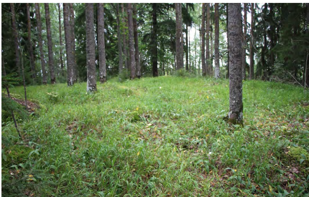
Mäkilehtolustevaltaista kuusikkoa Luhdankannan alueella (lohko 8)