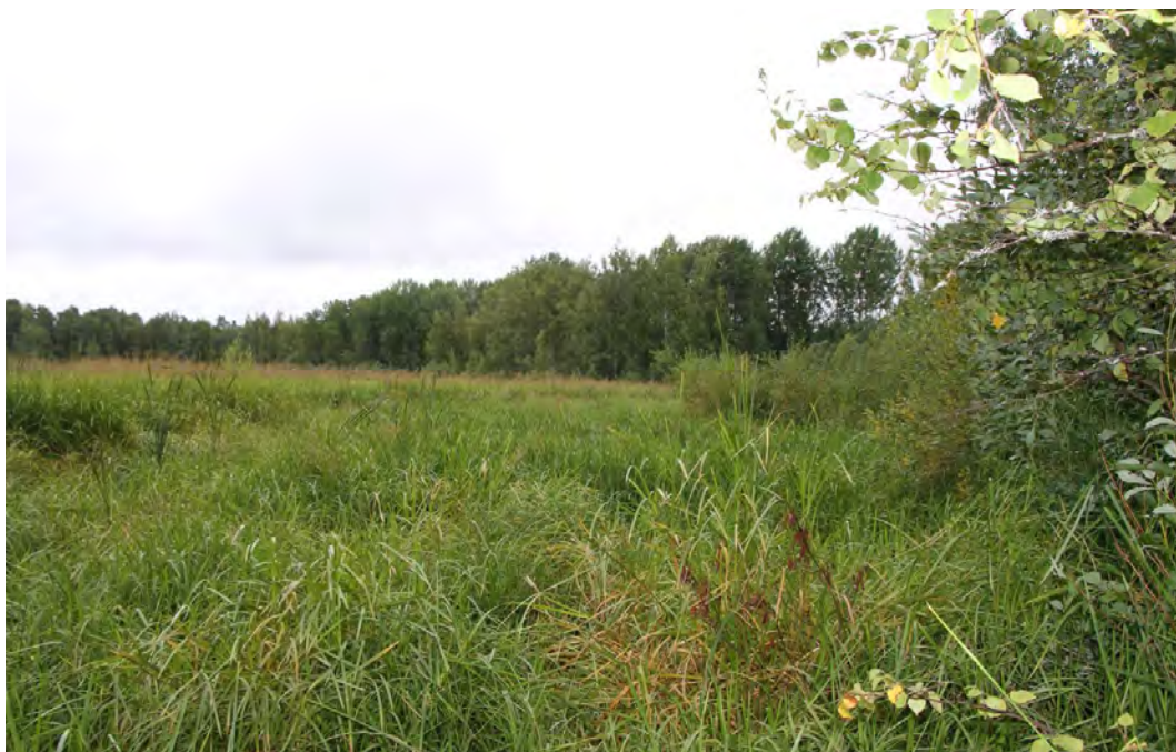
Luhdankannan länsipuoleista rantaluhtaa (lohko 8)

Luhdankannan niemelle johtavan pengertieuran kummallakin puolen on istutettua rauduskoi-vikkoa ja osassa koivuista näkyy visamaisia piirteitä eli kyseessä lienee istutettu visakoivikko. Maapohja on alueella kosteaa ja alue on entistä ojitettua niittyä joka on metsitetty. Pengertien ympäristössä kasvillisuus on kulttuurivaikutteista ja täyttömään mukana alueelle on levinnyt mm. pujoa ( Artemisia vulgaris ), nokkosta ja vieraslajeista jättipalsamia ( Impatiens glandu-lifera ). Koivikon alla kasvilajistoon kuuluu mm. metsänalvejuurta, pelto- ja metsäkortetta,