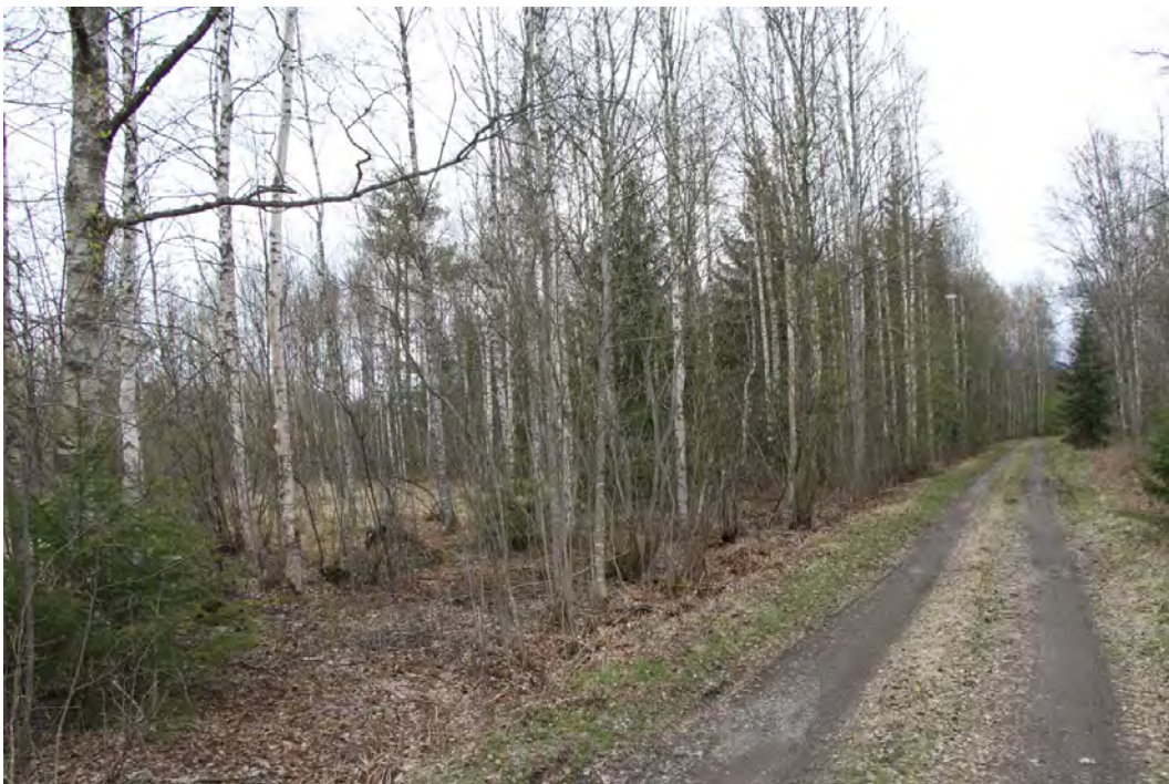
Lohkon 1 nuorta lehtimetsää

Lohko käsittää Näppilänsalmen etelärannalla sijaitsevan rannan ja tien rajaaman alueen. Alueen itäreunalla on vanha kesäkäytössä oleva talo pihapiireineen sekä pieni peltoalue. Muu alue on kosteapohjaista tasamaalla kasvavaa lehtipuuvaltaista, nuorta metsää. Tiheä puusto koostuu hieskoivuista ( Betula pubescens ), harmaalepistä ( Alnus incana ), kuusista ( Picea abies ) ja muutamista raidoista ( Salix caprea ). Pensaskerroksen lajistoon kuuluu tuomi ( Prunus padus ) ja alueen reunoilla myös kiilto- ja tuhkapaju ( Salix phylicifolia ja S. cinerea ). Aluskasvillisuus on melko rehevää ja erityisesti alueen päätien puoleisella reunalla mesiangervikko ( Filipendula ulmaria ) on hyvin korkeaa. Aluskasvillisuus on heinävaltaista ja paikoin kasvillisuus on niukka varjostuksen vuoksi. Varvut puuttuvat alueelta täysin. Hieman vaateliaammasta kasvilajistosta mainittakoon hiirenporras ( Athyrium filix-femina ) ja valkovuokko ( Anemone ne-