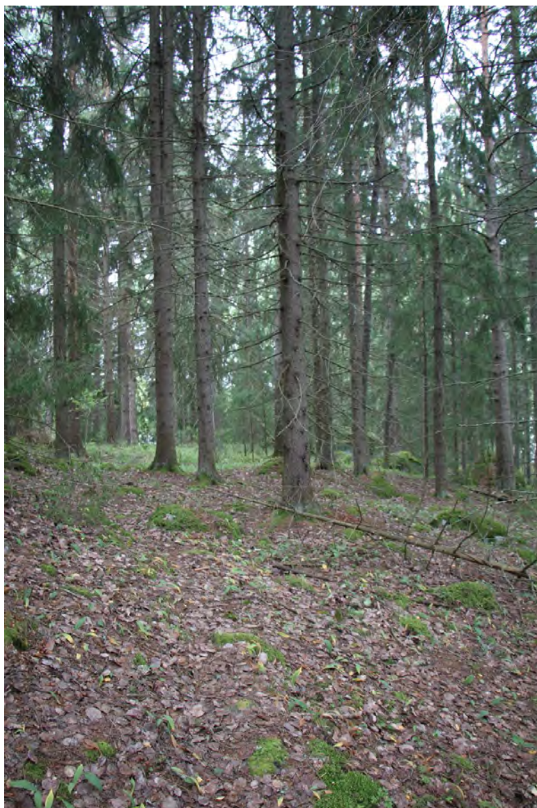
Yleiskuva lohkon 6 länsiosasta

Pellon ja rannan väliin jää varttunut kuusikko, jossa kuusikon seassa kasvaa jonkin verran haapaa, rauduskoivua ja mäntyä. Alueella on muutama poikkeuksellisen kookas kilpikaarnamänty. Aluetta on osittain hoidettu talousmetsänä ja mm. tuulenskaatoja on kerätty alueelta tarpeiksi. Osin rinnealueelle sijoittuva lohko on metsätyypiltään kuivan kielotyypin lehdon ja oravanmarjatyyppin tuoreen kankaan sekatyypin. Pensaskerroksessa esiintyy taikanamarjaa ja paikoin myös pienikokoisia koiranheiden taimia ( Viburnum opulus ). Aluskasvillisuus on paikoin hyvin niukkaa varjostuksen vuoksi. Lehtolajeista alueella kasvaa mäkilehtolustetta ( Brachypodium pinnatum ), kieloa ( Convallaria majalis ), sinivuokkoa, nuokkuhelmikkää ( Melica nutans ) ja vanhan ladon lähistöllä myös pikkukäenrieskaa. Tuoreen kankaan laikuilla mustikka ja käenkaali kasvavat valtalajeina. Alueen keskiosassa on pieni jyrkänne, jonka kasvilajisto on kuitenkin tavanomaista. Vaikka alueelta on kerätty polttopuuta, on alueella edelleen jonkin verran lahoppuuta ja myös muutamia kolopuita. Lohkon alueella havaittiin pesivänä käpytikka ja puukiipijä. Vanhan ladon vieressä oli mäyrän ulostepaikka.