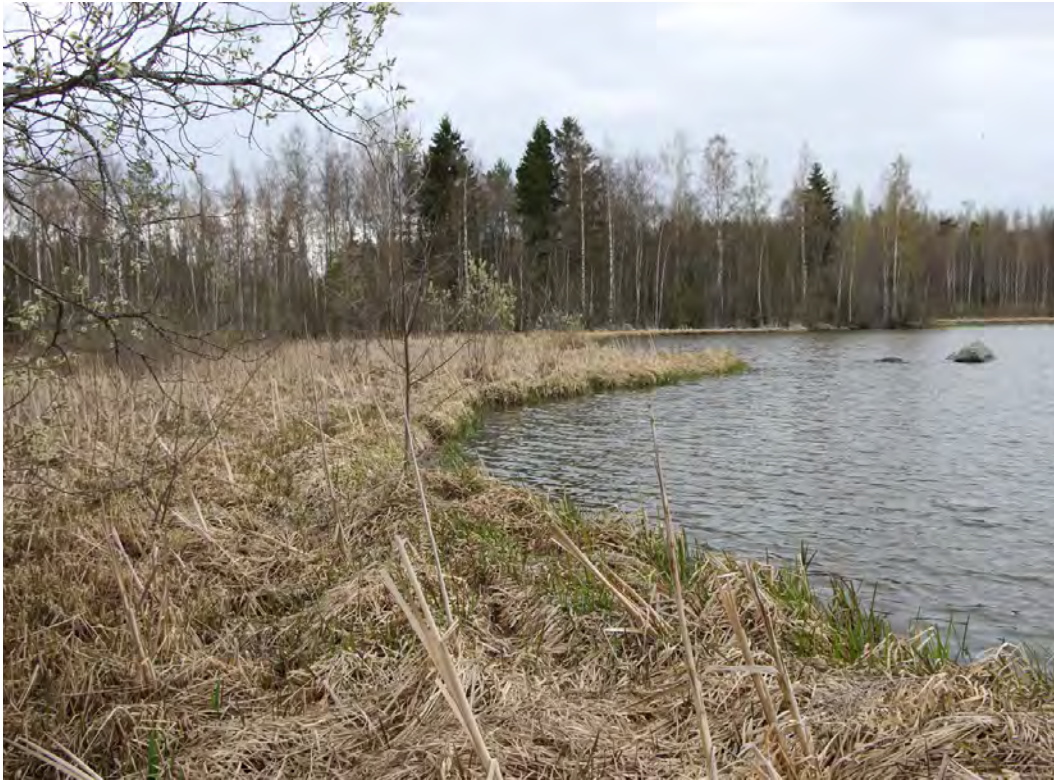
Lohkon 4 alueella on kapea rantaluhta